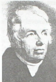
Alois Klar (20. léta 19. století)

především jako velký humanista, dobro- ditel a organizátor péče o slepé občany a mecenáš umění a chudých studentů filologie.“ 5