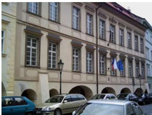
Budova Deylova ústavu pro slepé v Praze Později Konzervatoře pro mládež s vadami zraku